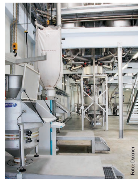
Aufgabestation für die Produktaufgabe von Sackware und Big Bag sowie die pneumatische Förderung in den zugehörigen Tagessilo.

Zur Verarbeitung der Feststoffe stehen zwei kombinierte Aufgabestationen zur Verfügung, die wahlweise mittels BIG-BAG oder